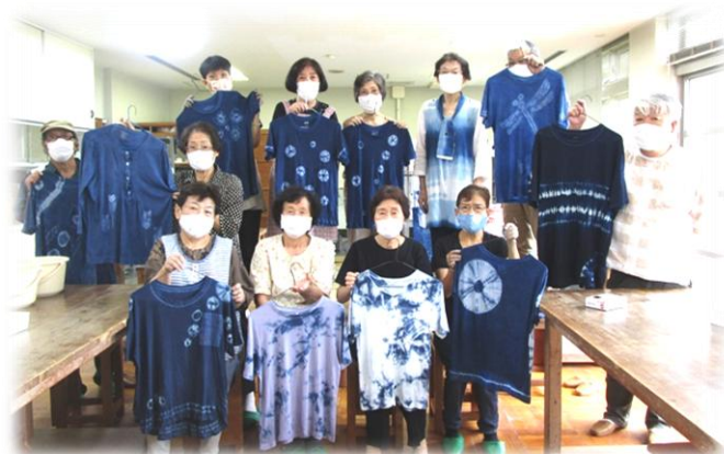
初心者とは思えない出来ばえで、皆さん満足顔！