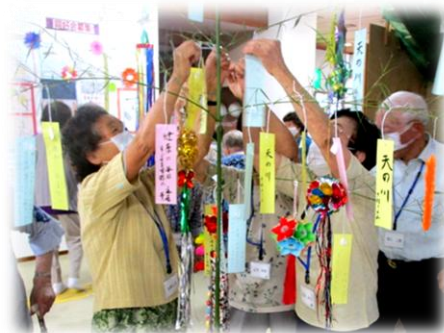
短冊に願いを込めて！

館内の利用者や元気はつらつ教室の利用者は、7月7日五色の短冊にそれぞれ思い思いの願い事を書き、笹に結びました。子どものころを懐かしむように七夕飾りを楽しんでいる様子でした。一番多かった願い事は、「新型コロナウイルスの終息を願う」でした。早くマスクがとれて皆さんのはじけるような笑顔が見たいものですね。