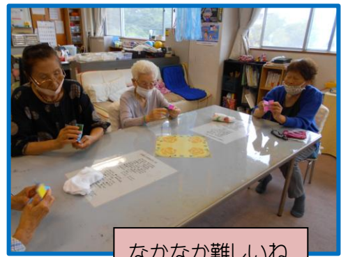
なかなか難しいね